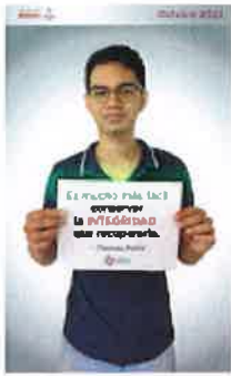
OCTUBRE 2022.png 525K