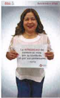
NOVIEMBRE 2022.png 551K